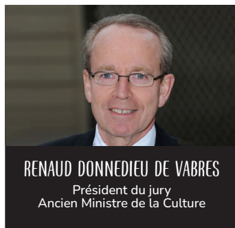
RENAUD DONNEDIEU DE VABRES

La Reconnaissance Territoire de Culture permet de participer au Prix Annuel Territoire de Culture dont la première édition se tiendra fin 2023 avec les membres du jury suivants.