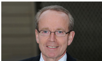
RENAUD DONNEDIEU DE VABRES